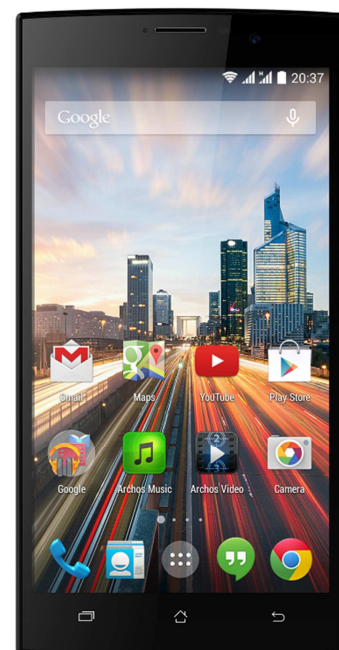
ARCHOS 62 Xenon