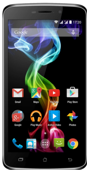
ARCHOS 52 Platinum

Ces smartphones incluent également le meilleur du multimédia sur Smartphone avec les applications ARCHOS Media Center: avec leurs écrans de grande qualité, l'utilisateur n'aura que l'embarras du choix parmi des contenus très divers.